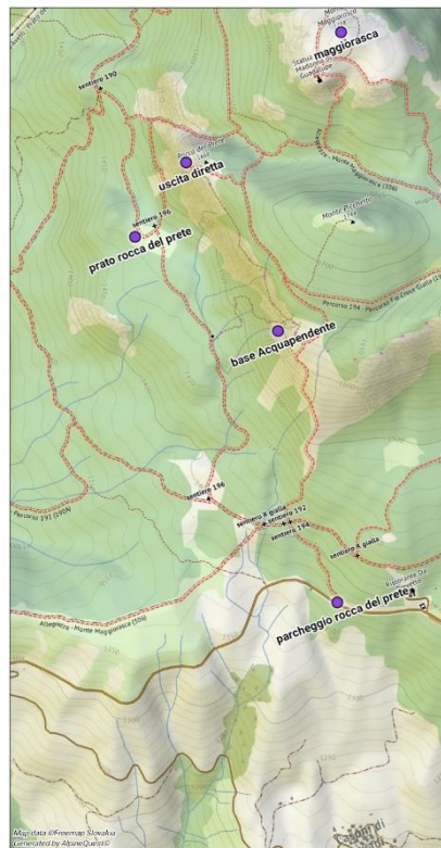
mappa rocca del prete

si segue il sentiero 194 fino ad incrociare il grande sentiero carrabile 192 che si segue verso sinistra fino all'incrocio con il sentiero 196 che sale verso il prato della rocca e il canale martincano.